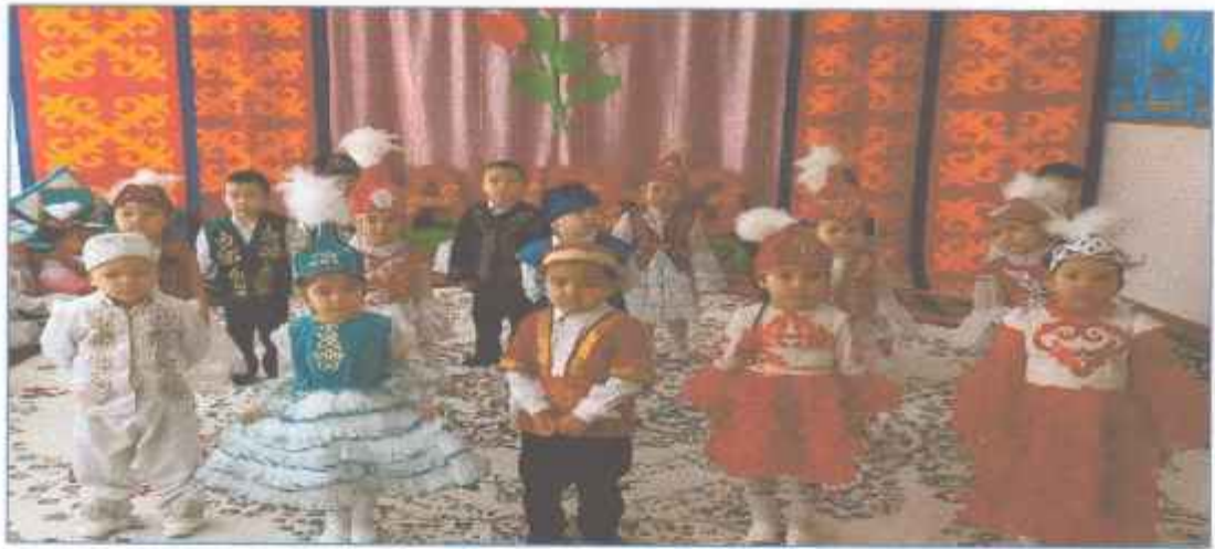
Ән: « Көктем» «Балбөбек »тобы